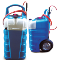
003600057 - PULVERIZADOR 100LT 12V BATERIA C/RESERVATORIO/ROTOSIS 4 UNID