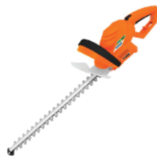
009000231 - PODADOR CERCA VIVA 600W/220V PE50/79833/513/ TRAMONTINA 11 UNID