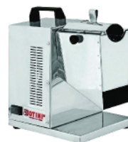
000100120 - RALADOR ELETRICO DE MILHO INOX/BOTINI 1 UNID