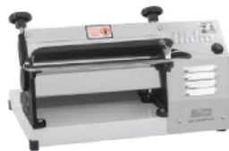
206100383 - CILINDRO P/MASSA M 1/4 HB250 7300/HIDRO 1 UNID