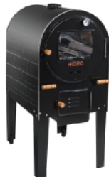
206100384 - FORNO MEDIO C/INOX 430 (INTERNO) - 1 Unid