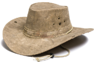
002800047 - CHAPÉU IDEAL DE TECIDO 29 - 5 Unid.