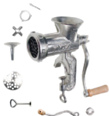
206100050 - PICADOR DE CARNE N.10/MIMOSO 1 UNID