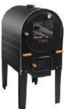
FORNO MEDIO C/INOX 430 (INTERNO) FHIMFI 7273/HIDR