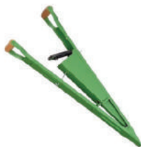
PLANTADEIRA MAN. MARILIA CONJUGADA 480/CADIOLI