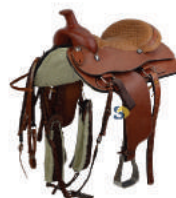
ARREIO 1008 ESP. ARG. INOX 608/KARANDA