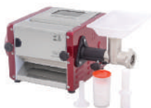
CILINDRO MULTIUSO 4 EM 1B C/MIST.3KG M 1/3 CV 2