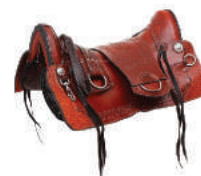
SELA AMERICANA M. LARGA 511/COURO ANDRADE