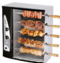
CHURRASQUEIRA ELETRICA GIRATORIO PRETO M1/30