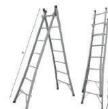
ESCALADA DOSE DUPLA 12 DEGRAUS 3,50