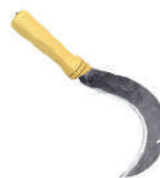
FOICE GABIRA XX