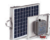
KIT CERCA ELÉTRICA SOLAR ZS 120I/ZEBU