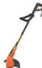
APARADOR P/ GRAMA AP1000T 220V