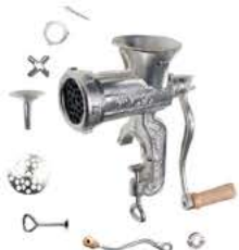
206100050 - PICADOR DE CARNE N.10/MIMOSO 1 UNID