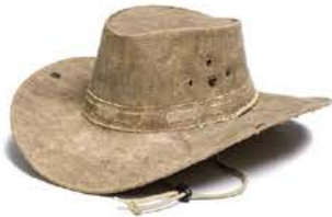
002800047 - CHAPÉU IDEAL DE TECIDO 29 - 5 Unid.