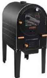
206100384 - FORNO MEDIO C/INOX 430 (INTERNO) - 1 Unid