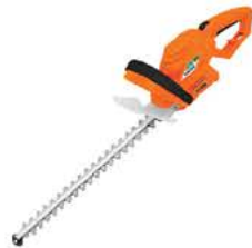
009000231 - PODADOR CERCA VIVA 600W/220V PE50/79833/513/TRAMONTINA 11 UNID