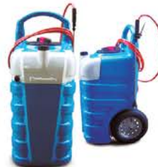
003600057 - PULVERIZADOR 100LT 12V BATERIA C/RESERVATORIO/ROTOSIS 4 UNID