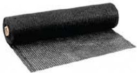
207600011 - TELA P/SOMBREAMENTO SOMBRAX 3,0X50MT 80%/NORTENE 100 MTS