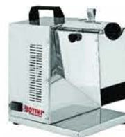
000100120 - RALADOR ELETRICO DE MILHO INOX/BOTINI 1 UNID