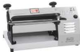
206100383 - CILINDRO P/MASSA M 1/4 HB250 7300/HIDRO 1 UNID