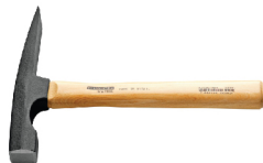
009000326 - MARTELO DE PEDREIRO 500GR/TRAMONTINA 11 UNID