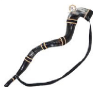
007200048 - BERRANTE CARREIRO EMENDA CHIFRE 4405/TEXANA 1 UNID