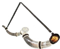
007200008 - BERRANTE GRANDE ESPECIAL/KARANDA 1 UNID