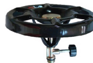
206100279 - FOGAREIRO ROSCA FINA - 3 UNID