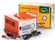
000100592 - CARREGADOR DE BATERIAS CB-100 1 UNID