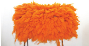
006900335 - COXINIL DE LÁ DE CARNEIRO - 1 Unid.