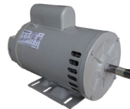
000200004 - MOTOR ELÉTRICO 1,5 CV NOVA MONOFÁSICO B.R. 1 Unid