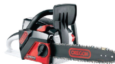
103300009 - MOTOSSERRA OREGON A BATERIA C/POWER SHARP 570744/OREGON 1 UNID